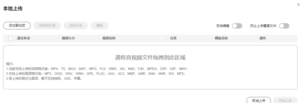
图 1-1 本地上传