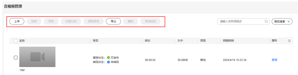
图 1-3 媒资处理