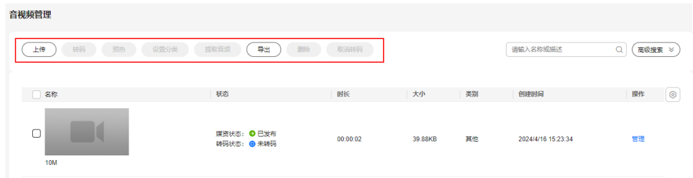
图 1-3 媒资处理