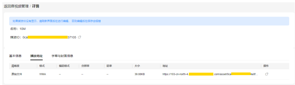
图 1-4 媒资详情