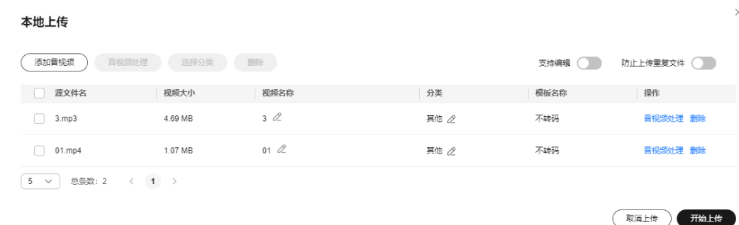
图 1-2 设置音视频处理