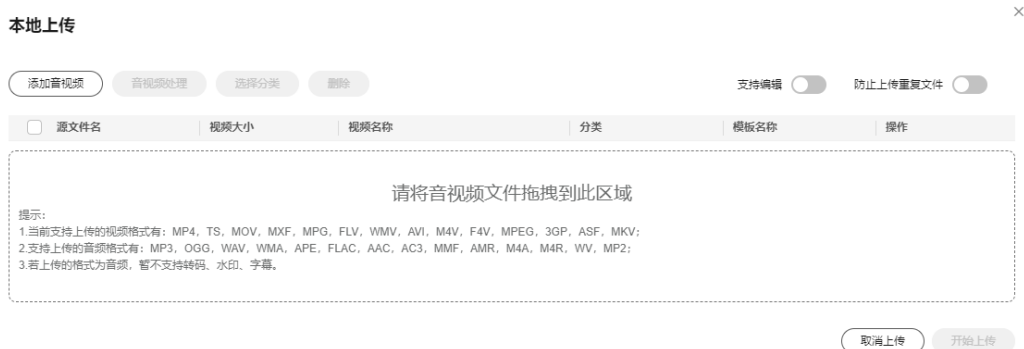
图 1-1 本地上传