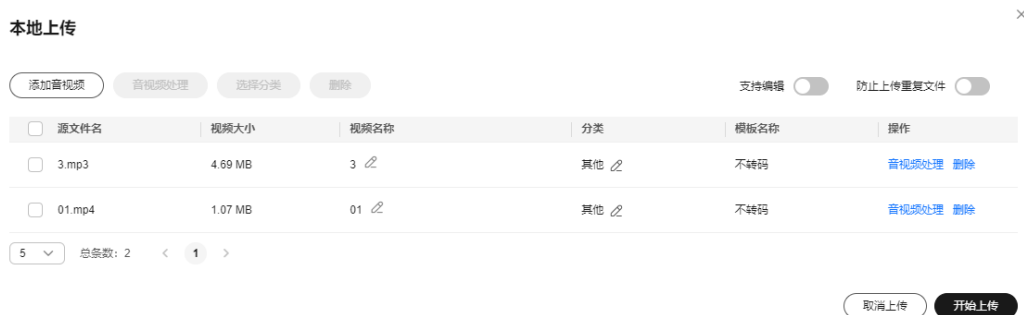
图 1-2 设置音视频处理