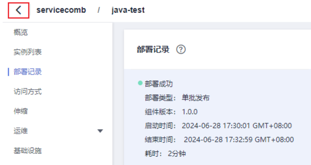
图 1-15 返回“组件管理”页面