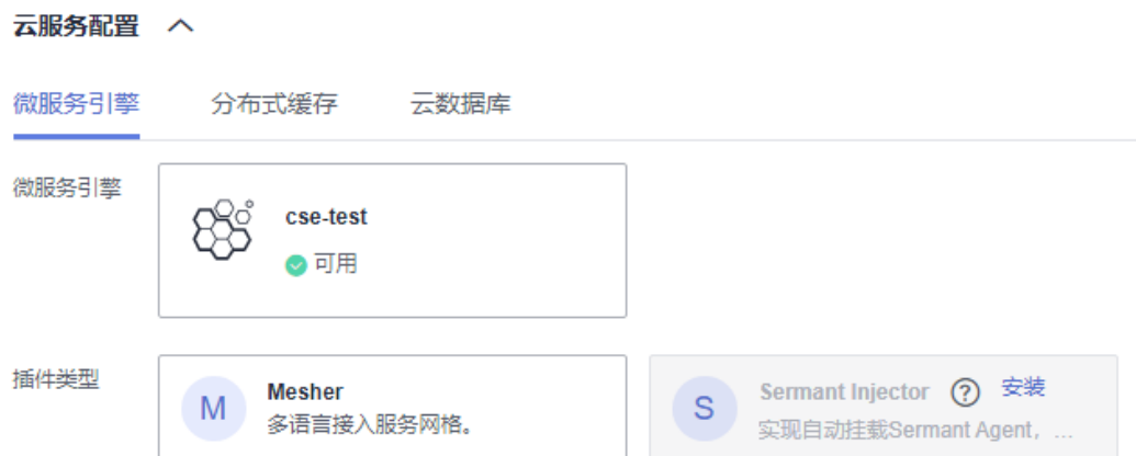
图 1-13 绑定微服务引擎