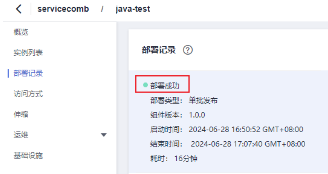
图 1-14 组件部署成功