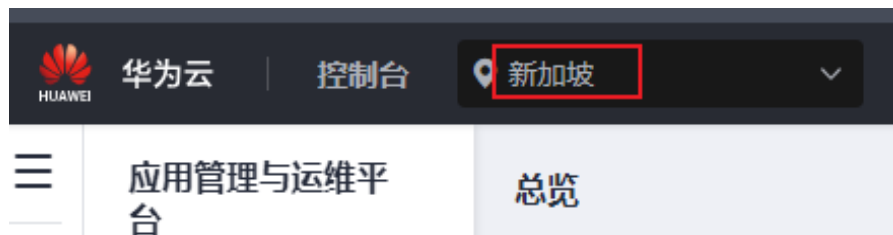
图 1-2 登录 ServiceStage 控制台

步骤2 在区域列表选择您准备使用ServiceStage的区域（例如：亚太-新加坡）。