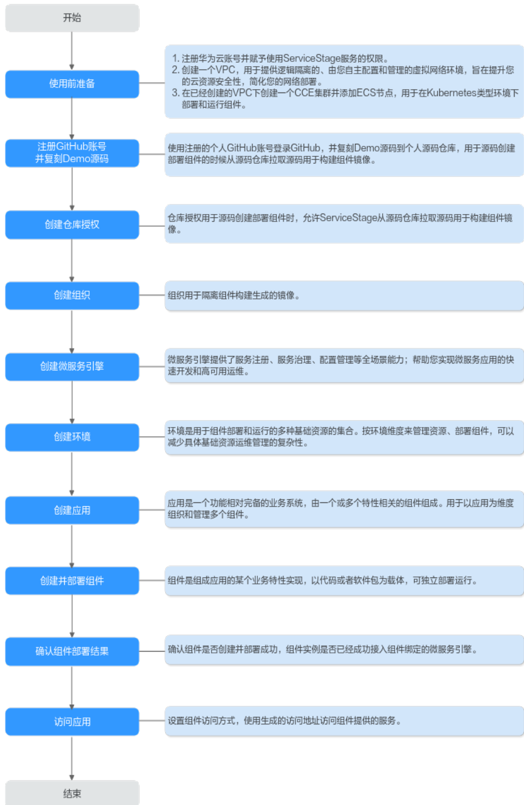
图 1-1 ServiceStage 使用流程