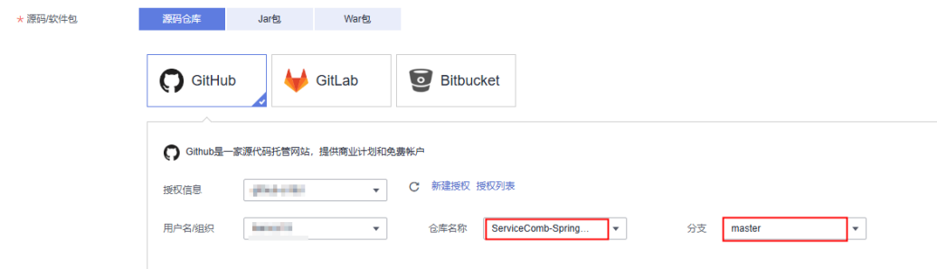
图 1-10 设置组件来源