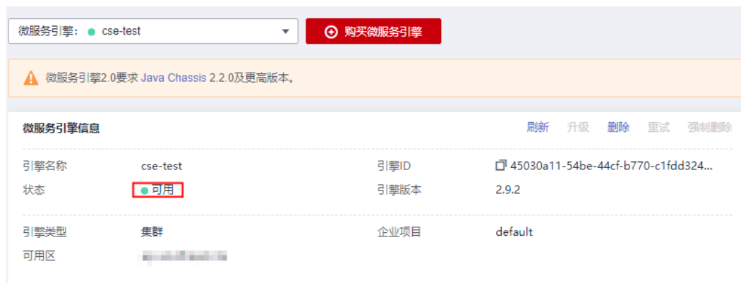
图 1-4 创建微服务引擎

微服务引擎创建完成，大约需要31分钟。微服务引擎创建成功后，“状态”为“可用”。