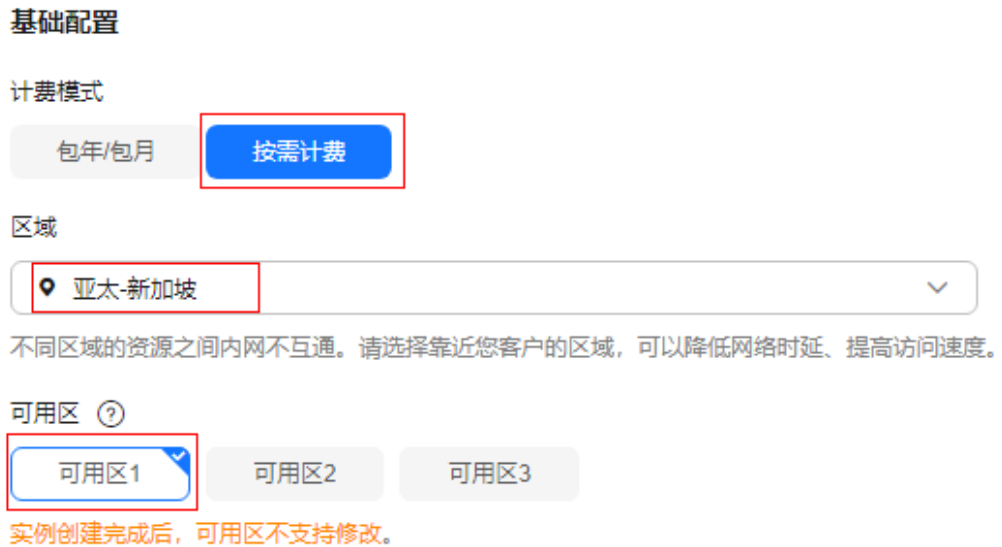
图 1-2 设置实例基础配置