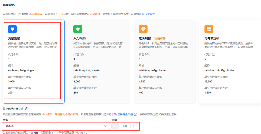
图 1-3 设置实例规格和存储空间