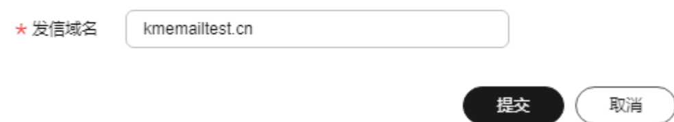
图 1-2 发信域名配置