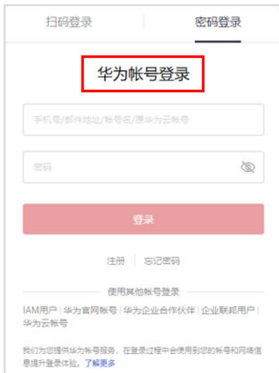
图 2-1 登录华为云