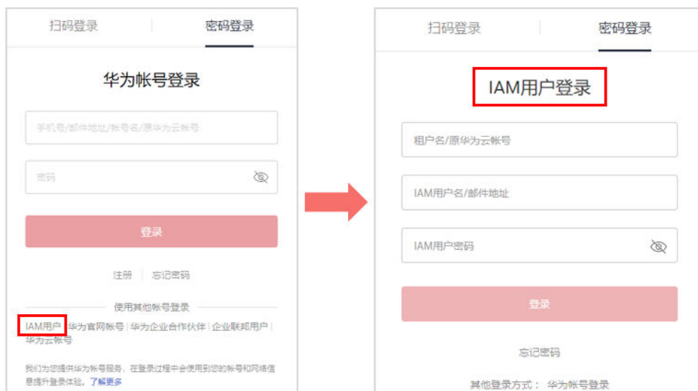
图 3-4 IAM 用户登录

步骤1 在登录页面，单击登录下方的“IAM用户”，在“IAM用户登录”页面，输入“租户名/原华为云账号名”、“IAM用户名/邮件地址”和“密码”。