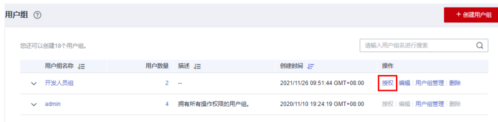
图 2-6 授权