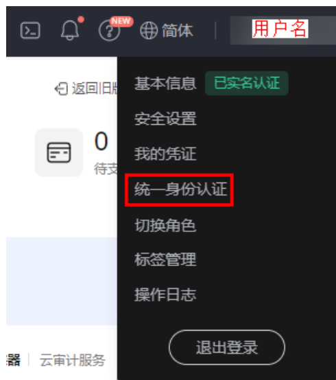
图 2-3 进入统一身份认证

步骤4 在统一身份认证服务，左侧导航窗格中，单击“用户组” > “创建用户组”。