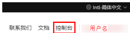
图 2-2 进入控制台

步骤3 在“控制台”页面，鼠标移动至右上方的用户名，在下拉列表中选择“统一身份认证”。