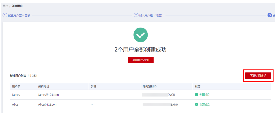
图 3-3 用户创建成功

步骤5 参考 步骤1-步骤4 的方法，创建用户Charlie、Jackson和Emily，并加入对应的用户组。 ----结束