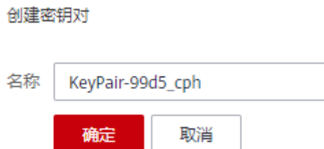
图 1-2 创建密钥对

密钥对名称由两部分组成：KeyPair-4位随机数字，使用一个容易记住的名称，如KeyPair-xxxx_cph。