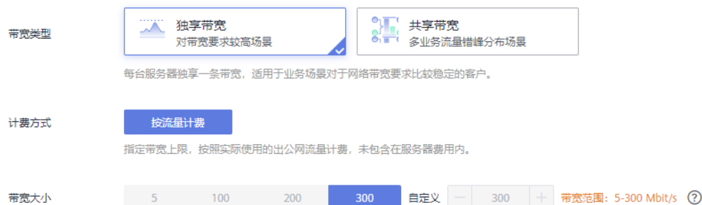
图 1-3 网络配置