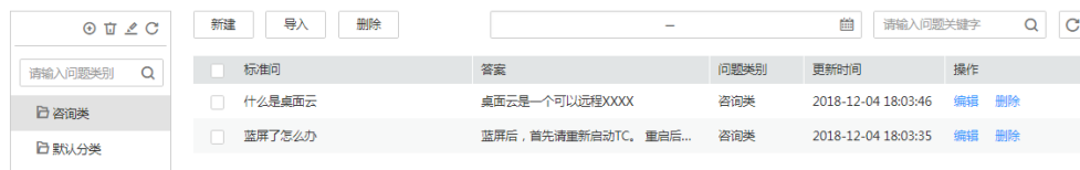
图 1-2 新建语料