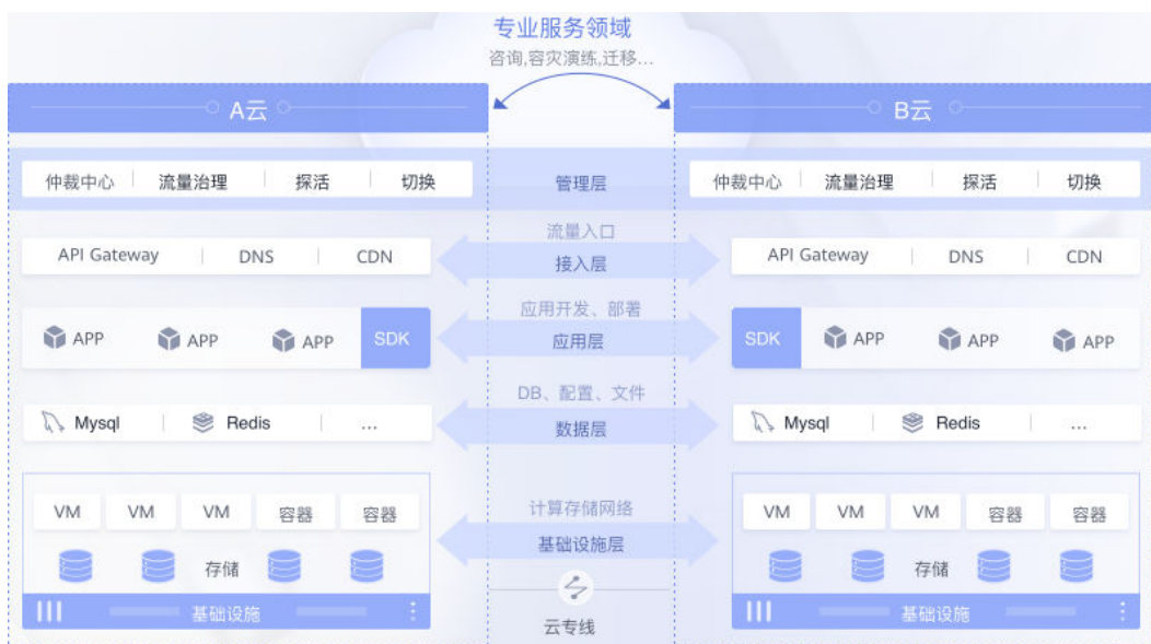
图 1-1 MAS 服务架构示意图