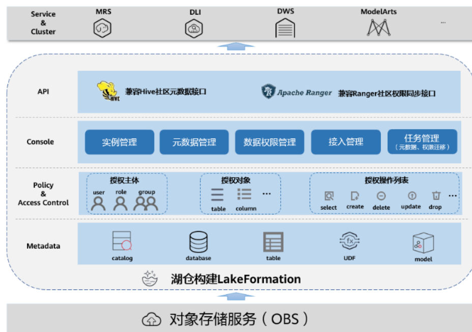
图 1-1 LakeFormation 服务架构