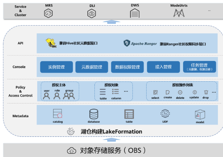
图 1-1 LakeFormation 服务架构