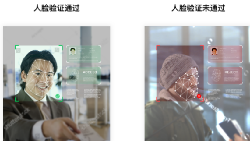
图 2-1 身份验证