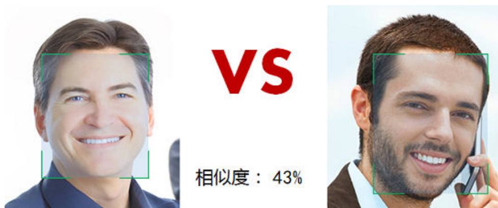
图 1-2 人脸比对示意图

通过对人脸区域的特征进行对比，该服务可以返回给用户两张图片中人脸的相似度。如果两张图片中包含多张人脸，则在两张图片中选取最大的人脸进行相似度比对。