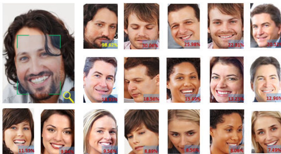
图 1-3 人脸搜索示意图