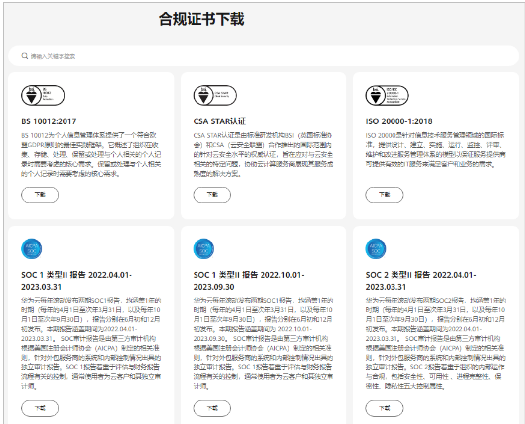
图 7-2 合规证书下载