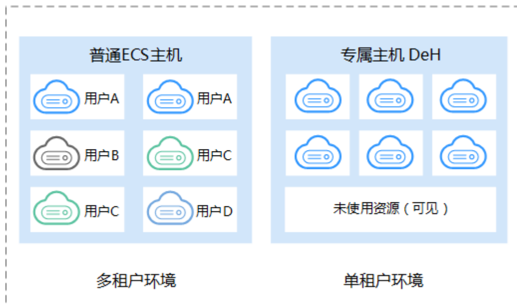
图 1-1 专属主机与普通 ECS 主机对比

您作为专属主机的唯一租户，不需要与其他租户共享主机的物理资源，您还可以获取这台服务器的物理属性，包括Sockets、物理内核、CPU类型、内存大小，并根据专属主机规格创建指定规格族的云服务器。