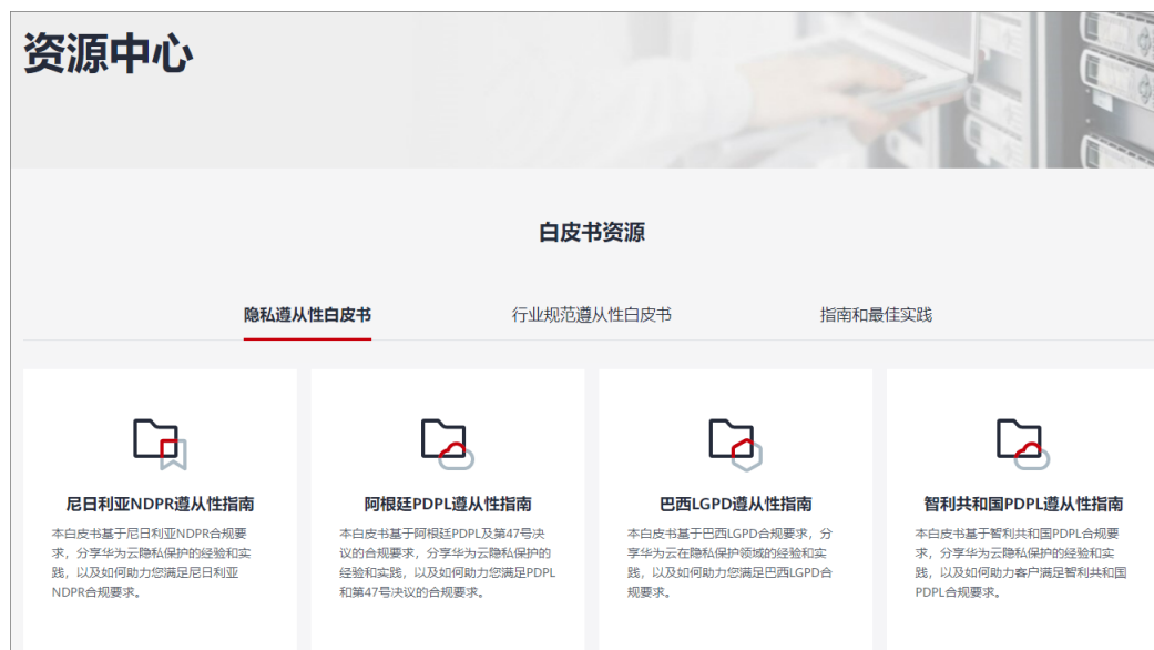
图 3-3 资源中心