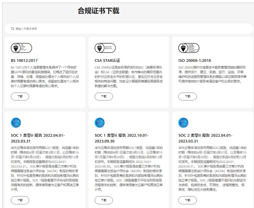
图 3-2 合规证书下载