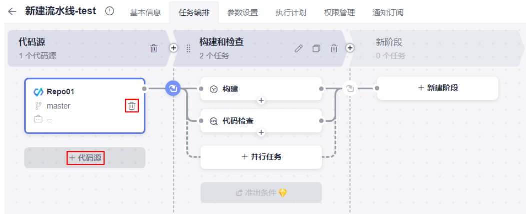
图 2-1 更新代码源