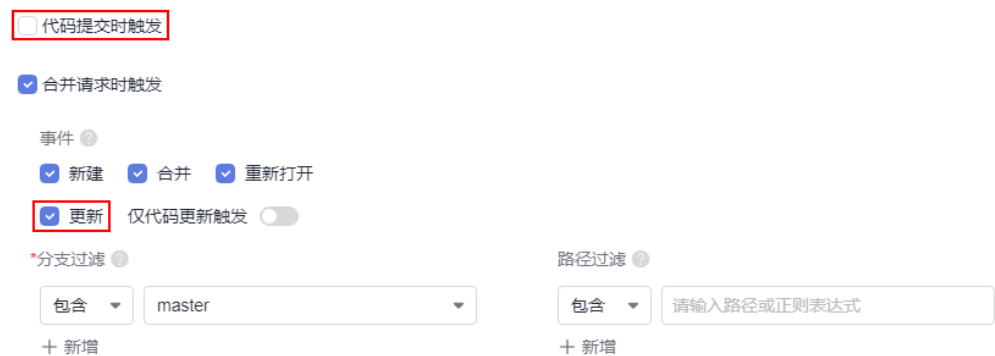
图 1-1 合并请求触发事件

综合上述两个条件，修改未关闭合并请求的源分支代码，且在流水线监听了合并请求的更新事件，提交代码时，会触发该合并请求的更新事件，如果该合并请求的目标分支在流水线监听范围内，则会触发执行相应的流水线。