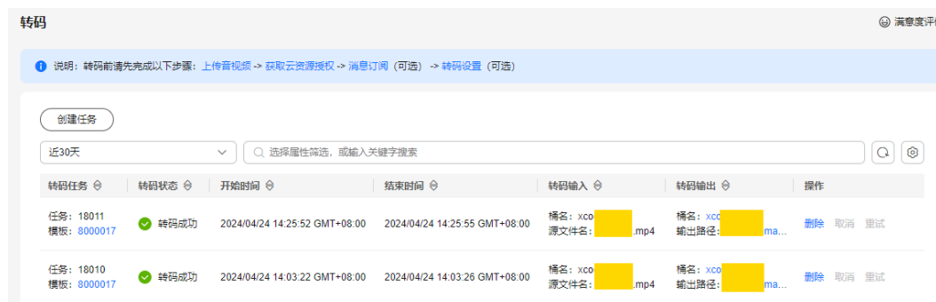
图 4-2 转码任务

步骤4 选择需要挂载的视频文件，单击“分享”，复制URL，将URL复制到其它网站即可。 URL分享时间有效期设置，可参见 分享文件 。