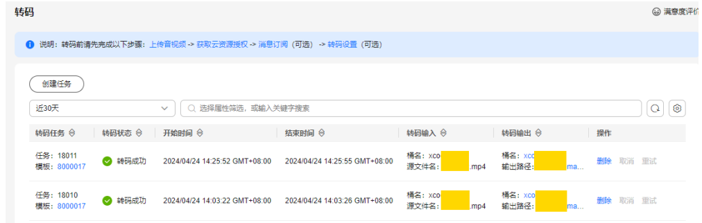
图 4-1 转码任务