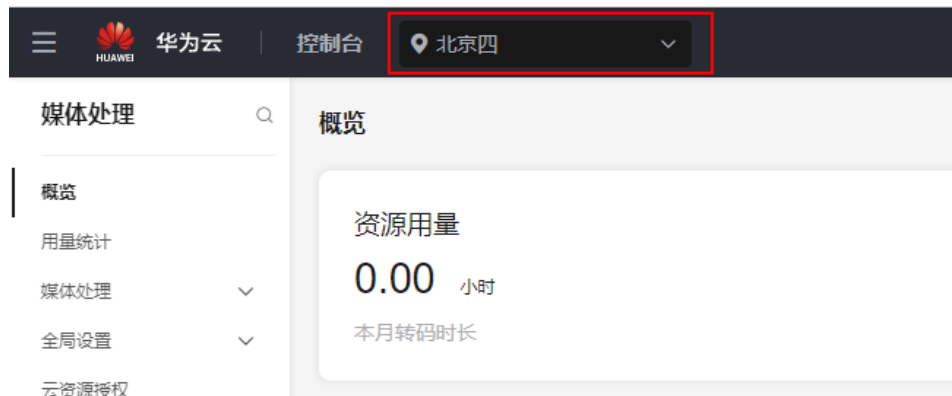
图 4-3 媒体处理服务区域