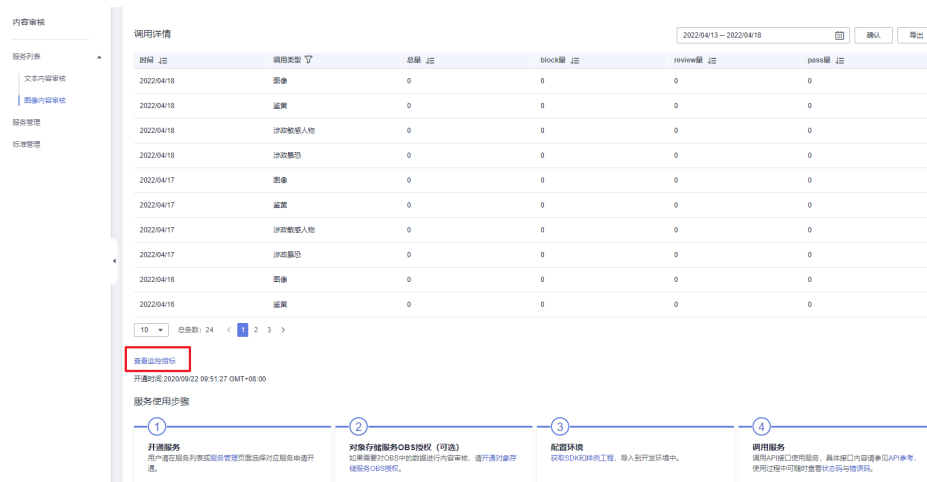
图 4-1 查看监控数据