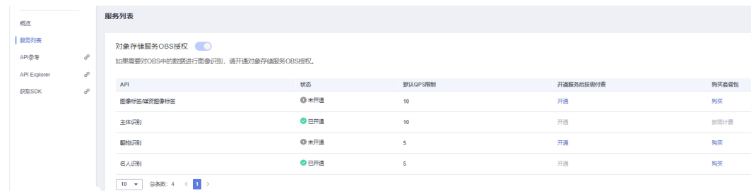
图 1-1 已开通服务

服务开通后，已申请的服务可在图像识别服务控制台的“服务列表”页面内查看，如不想再使用本服务，无需关闭，不调用即可。