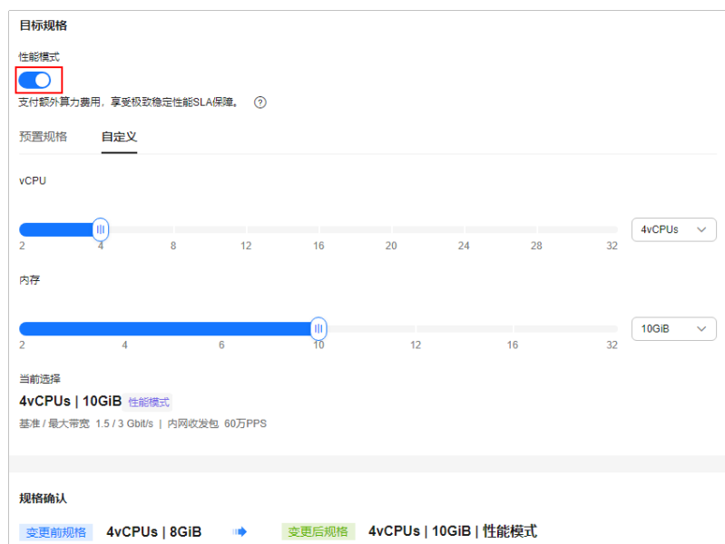
图 4-2 通过“变更规格”功能开启性能模式

变更为性能模式时，可能会因为资源不足而无法选取相同的vCPU/内存规格，您可以选择其他合适性能模式规格。