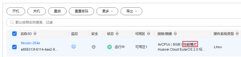
图 4-1 开启性能模式的 Flexus X 实例

如果您的Flexus X实例已开启性能模式，在Flexus X实例控制台的“规格/镜像”列中，您可以看到“性能模式”字样。如果没有“性能模式”字样，表示您的Flexus X实例未开启性能模式。