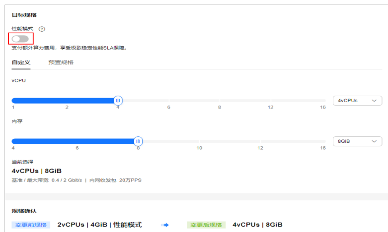
图 4-3 通过“变更规格”功能关闭性能模式