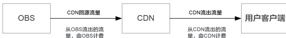
图 2-1 OBS 计费示意图