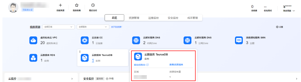
图 1-1 我的资源页面