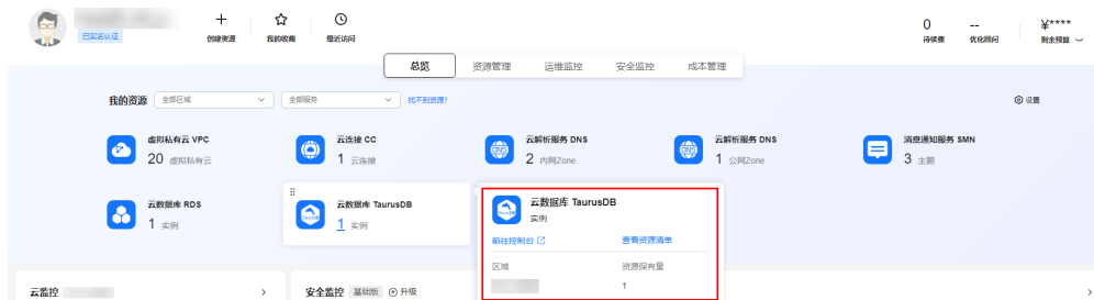
图 1-1 我的资源页面