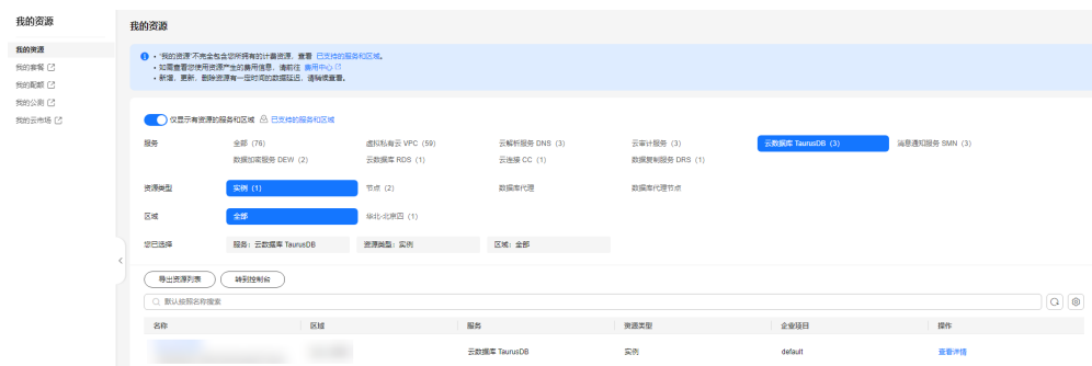
图 1-3 我的资源页面