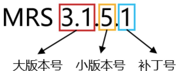
图 2-1 MRS 普通版集群版本号