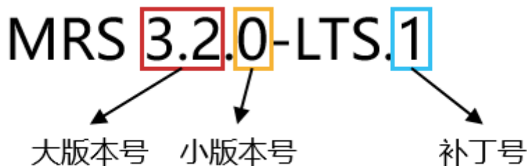
图 2-2 MRS LTS 版集群版本号