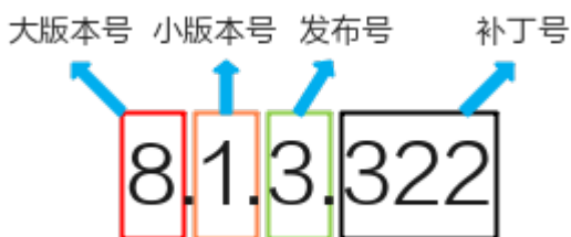
图 2-1 GaussDB(DWS)版本号说明

而每一个发布号版本发布后，会发布补丁用于修复问题，例如8.1.3.322补丁版本。即补丁号仅修复问题，不新加功能特性。