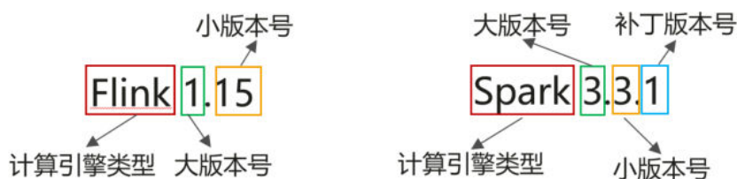
图 2-1 DLI 计算引擎版本号

DLI计算引擎版本号：格式为 计算引擎名称 x.y.z ，其中计算引擎分为Flink和Spark，版本号具体含义如 图2-1 所示。