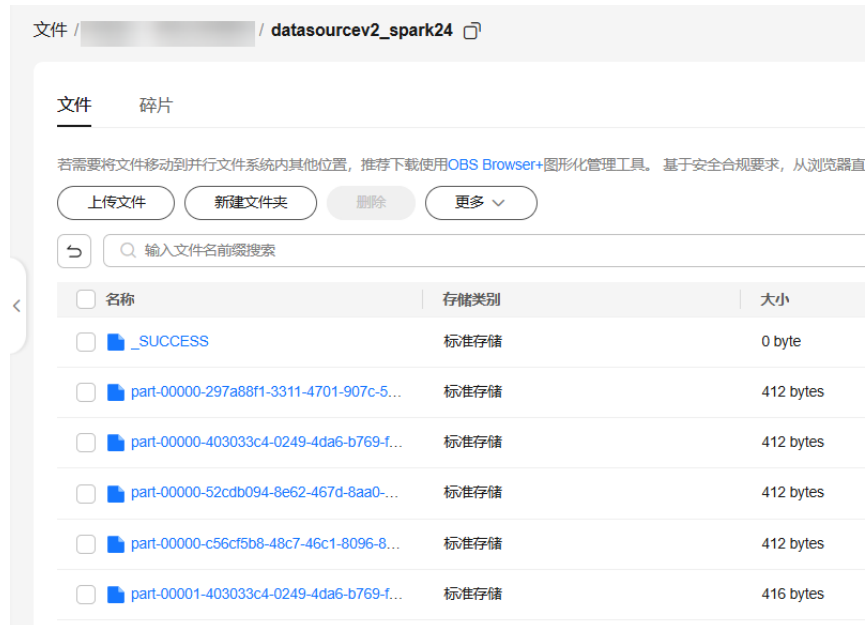
图 2-3 DLI datasource v2 表