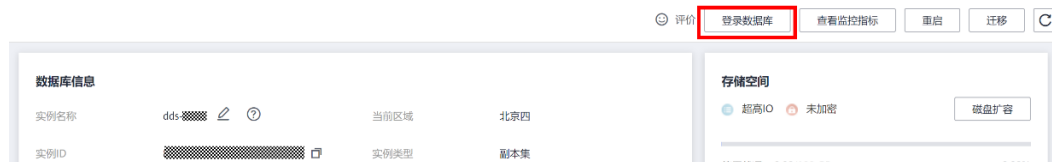
图 2-2 登录数据库

步骤7 实例创建完成后，在“实例管理”页面单击对应的实例，然后单击“登录数据库”。即可通过DAS登录数据库，DAS具体操作参考 DAS用户指南 。其他数据库连接方式参见 实例连接方式介绍 。