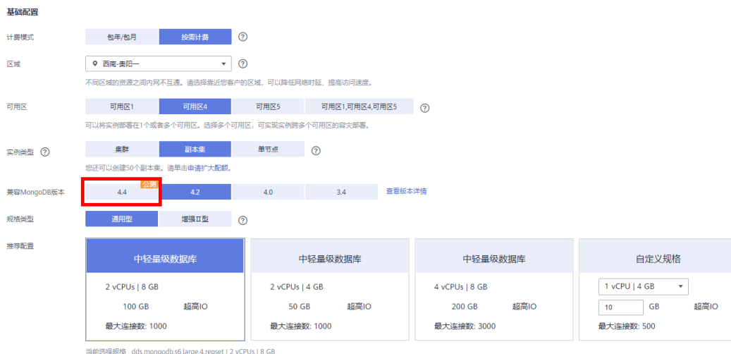
图 2-1 配置信息

步骤5 “区域”选择当前公测中的区域，购买页面“兼容MongoDB版本”选择“4.4”，其他配置项按需选择，参考 快速购买 和 自定义购买 。