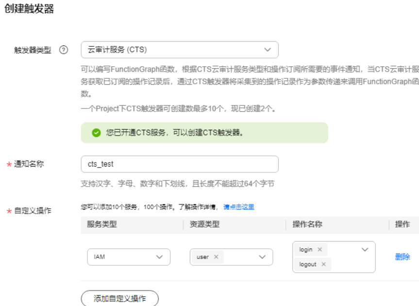
图 1-2 创建 CTS 触发器

CTS云审计服务监听IAM服务中user资源类型，监听login、logout操作。