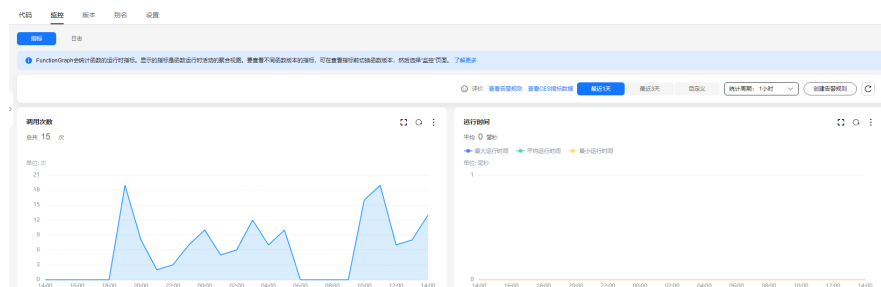
图 1-4 函数指标