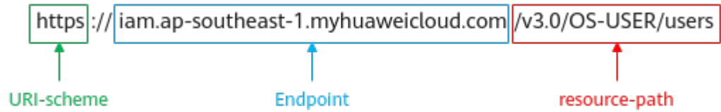
图 3-1 URI 示意图

https://iam.ap-southeast-1.myhuaweicloud.com/v3.0/OS-USER/users