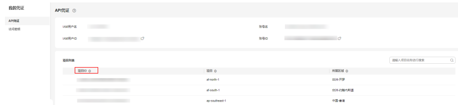
图 6-1 查看项目 ID