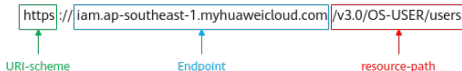
图 3-1 URI 示意图

https://iam.ap-southeast-1.myhuaweicloud.com/v3.0/OS-USER/users