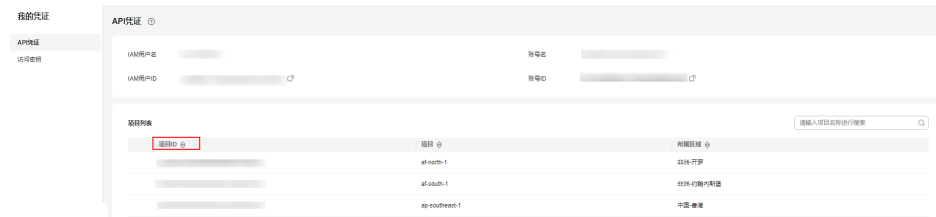
图 A-1 查看项目 ID