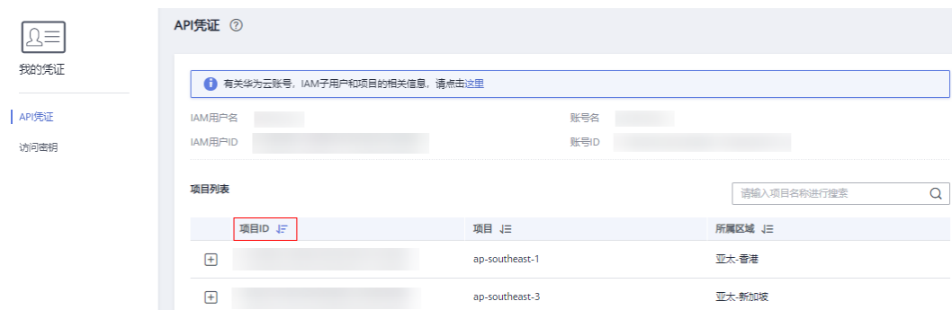
图 13-1 查看项目 ID