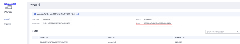
图 12-2 查看帐号 ID