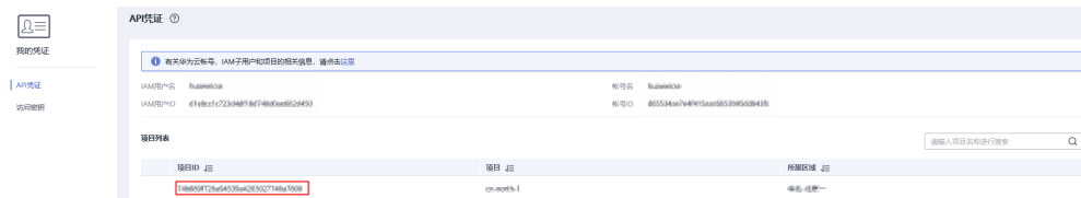
图 12-1 查看项目 ID