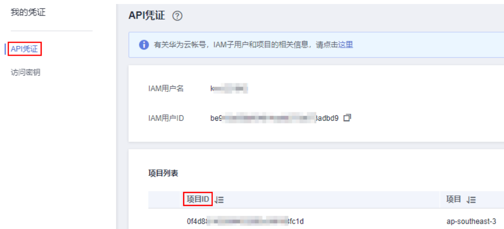
图 6-1 查看项目 ID