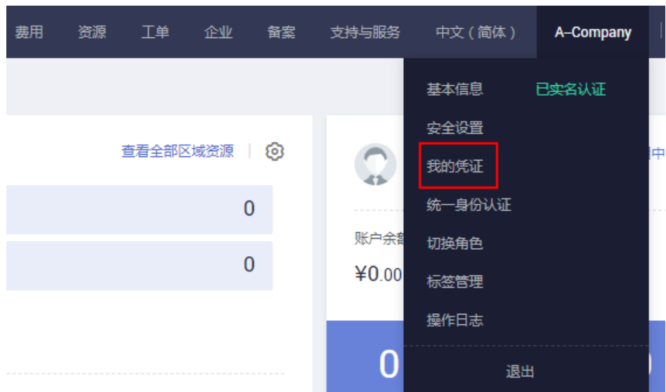
图 6-1 进入我的凭证