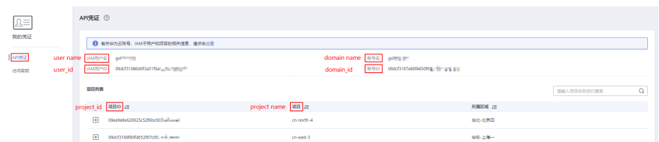
图 6-2 查看账号名、账号 ID、用户名、用户 ID、项目名称、项目 ID