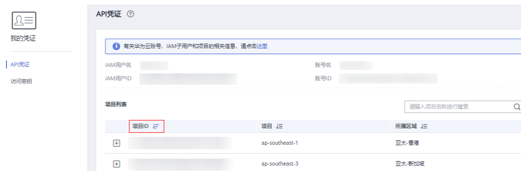
图 7-1 查看项目 ID