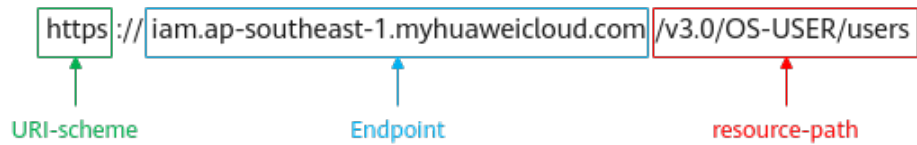
图 3-1 URI 示意图

为方便查看，在每个具体API的URI部分，只给出resource-path部分，并将请求方法写在一起。这是因为URI-scheme都是HTTPS，而Endpoint在同一个区域也相同，所以简洁起见将这两部分省略。