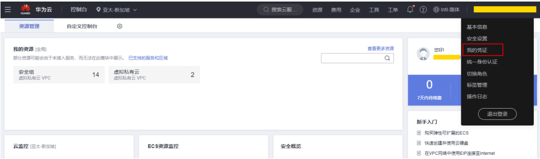
图 16-1 管理控制台