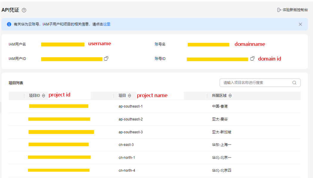
图 16-2 获取项目 ID