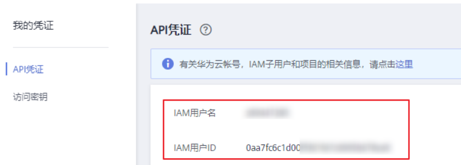
图 14-3 获取用户名和 ID