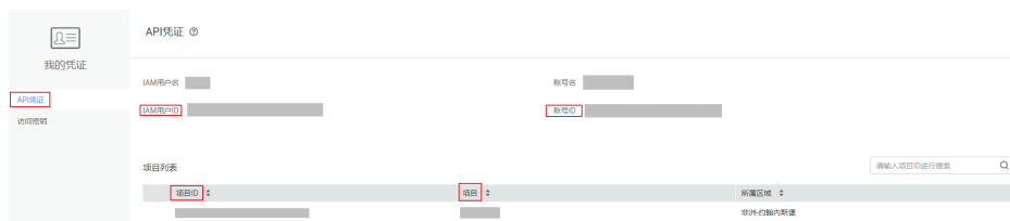
图 7-2 获取账号 ID