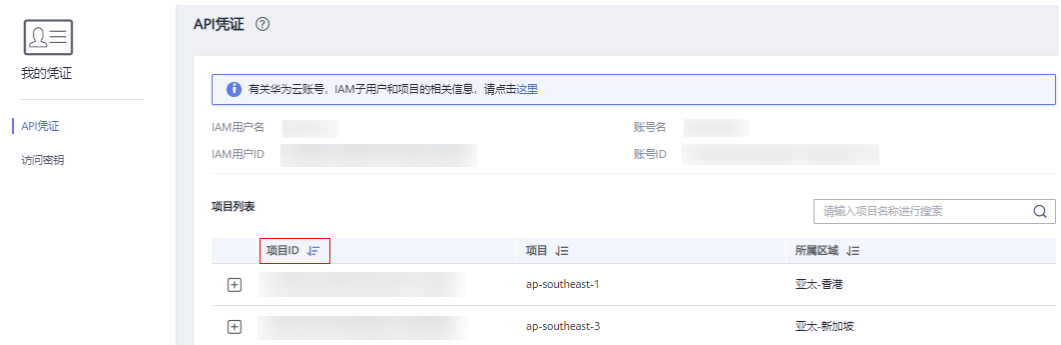
图 9-1 查看项目 ID