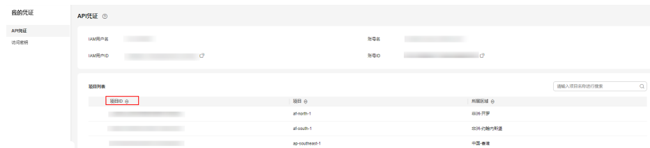
图 9-1 查看项目 ID