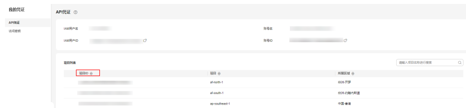
图 9-1 查看项目 ID