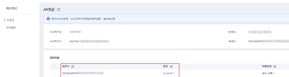
图 6-2 查看项目 ID