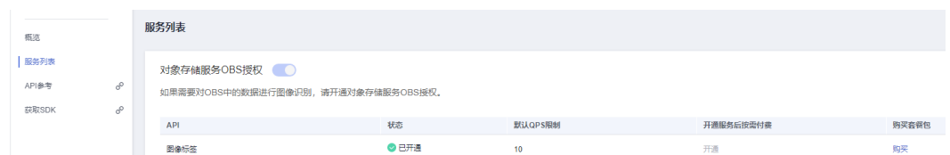
图 3-1 服务列表