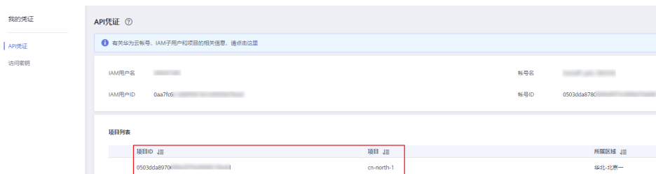
图 7-2 查看项目 ID