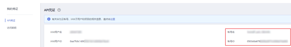
图 7-3 获取账号名和 ID