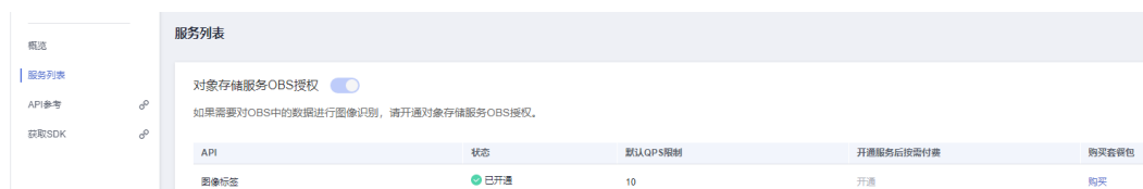
图 3-1 服务列表