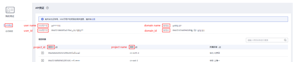
图 5-2 查看账号名、账号 ID、用户名、用户 ID、项目名称、项目 ID