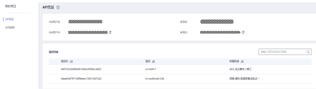
图 7-1 查看项目 ID