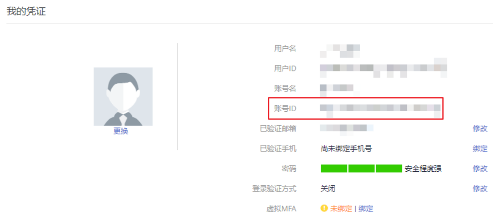
图 A-2 获取账号 ID