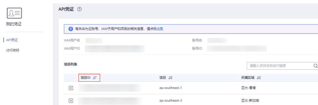
图 A-1 查看项目 ID