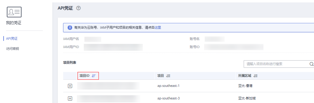
图 A-1 查看项目 ID