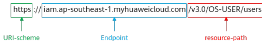
图 3-1 URI 示意图

https://iam.ap-southeast-1.myhuaweicloud.com/v3.0/OS-USER/users