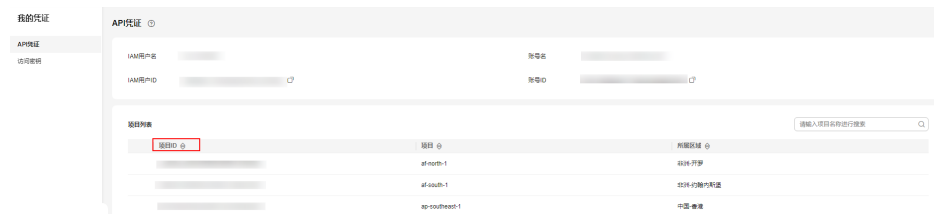
图 A-1 查看项目 ID