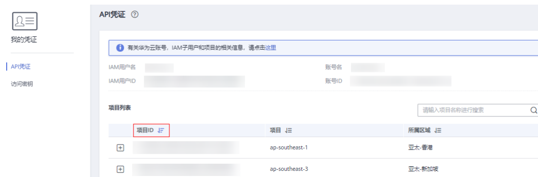
图 9-1 查看项目 ID