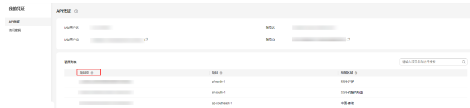
图 9-1 查看项目 ID