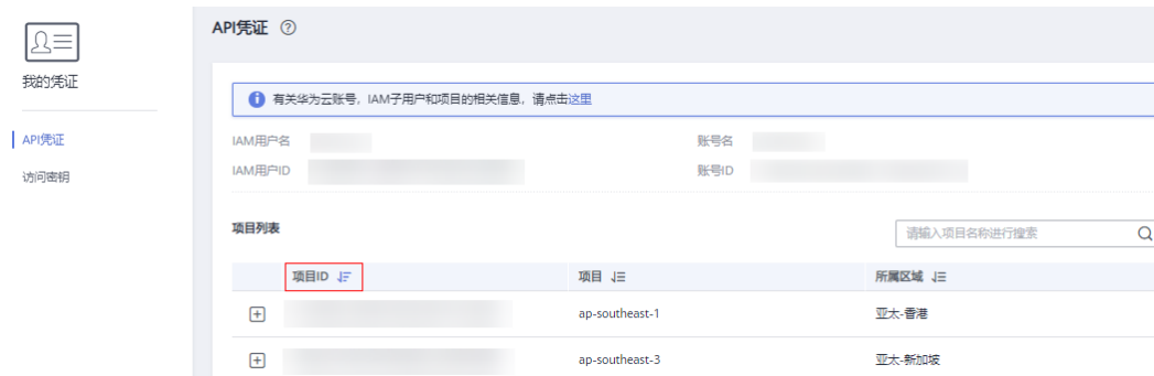
图 A-1 查看项目 ID